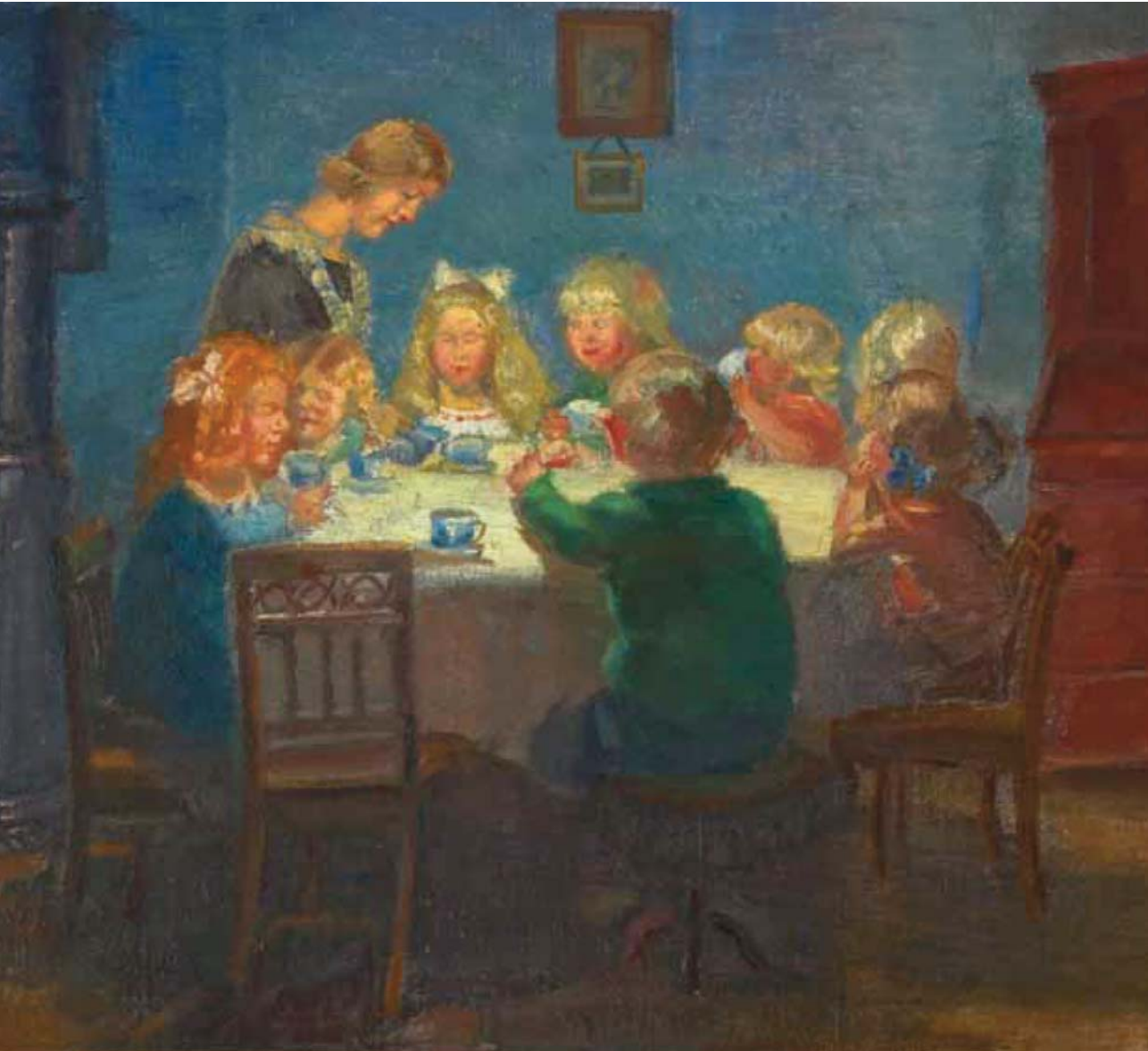
Anna Ancher: Børneselskab i den blå stue.