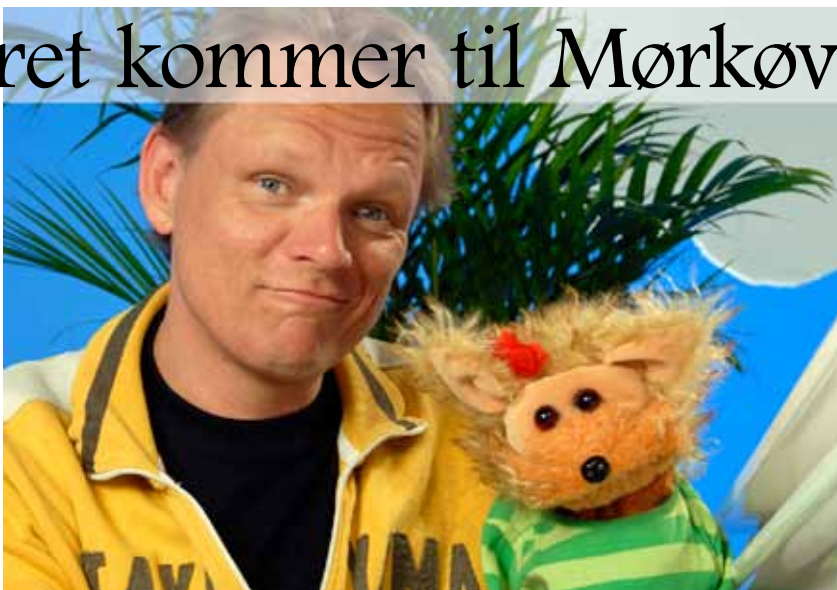
Du kan møde Sigurd Barret i Mørkøv Hallen d. 7. marts!

Sigurd Barrett er en kendt underholder fra TV. Han kan underholde både børn og voksne.