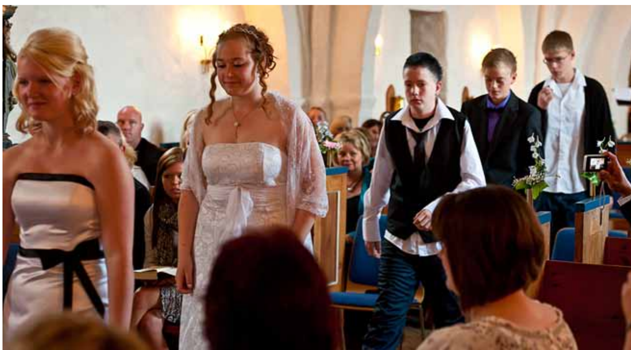
Konfirmation i Svinninge kirke, 22. maj 2011.