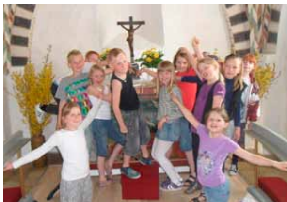
Minikonfirmander i Jyderup 2011.